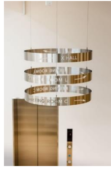
円形形状のサイン