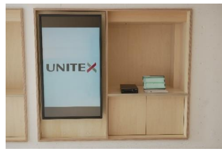
デジタルサイネージとデモ製品

*世界中に製品デモ・技術サポートをリアル・オンラインで発信する B1F「X Hall」 B1Fには X Hall と名付けられた、大規模ホールがあります。大型プロジェクターによる画面投影でのプレゼンテーションやイベント開催に加え、動画配信用カメラシステム、映像システム、音響システム、WEB 配信システムで高品質な製品デモや技術サポートをライブでも録画でも世界中のお客様にいつでも発信・連携できます。