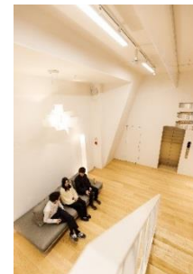
リラックススペース

*当社商材をモチーフにしたサインデザイン ユニテックスの商材である磁気テープメディアをイメージし、ステンレスの曲げ加工によって、各所にロゴマークや誘導サイン、室名サインを設置。エレベーターホールには、誘導サインとして、円形の形状による 360° のアート性もあるサインを設置しています。