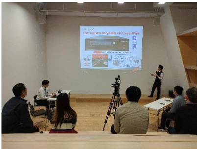
海外ユーザーへの製品デモ

*世界中に製品デモ・技術サポートをリアル・オンラインで発信する B1F「X Hall」 B1Fには X Hall と名付けられた、大規模ホールがあります。大型プロジェクターによる画面投影でのプレゼンテーションやイベント開催に加え、動画配信用カメラシステム、映像システム、音響システム、WEB 配信システムで高品質な製品デモや技術サポートをライブでも録画でも世界中のお客様にいつでも発信・連携できます。