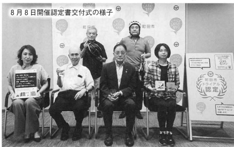
8月8日開催認定書交付式の様子

MACHIDA CITY TRIAL ORDER AUTHORIZATION SYSTEM 2023