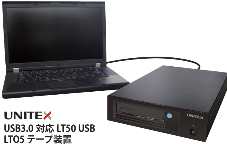
UNITE X USB3.0 対応 LT50 USB LT05 テープ装置